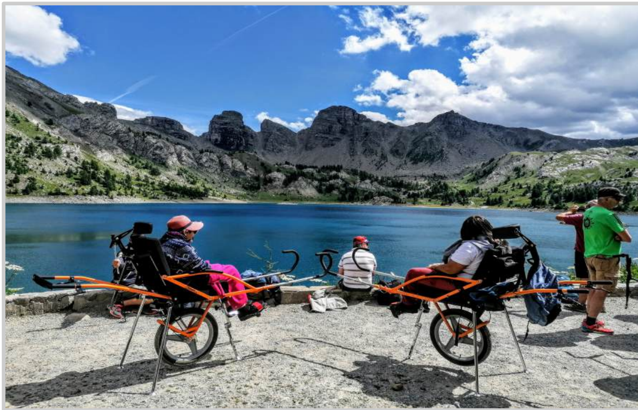
Sortie pour personnes à mobilité réduite autour du lac d'Allos