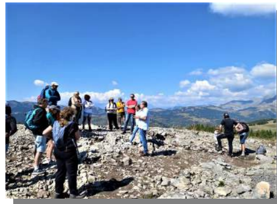
Site archéologique de la Tournerie – Roubion