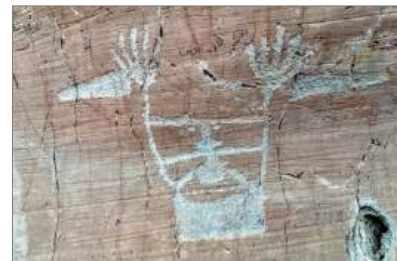
Vallée des Merveilles - Tende