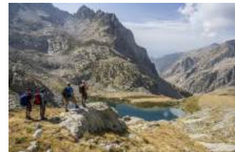
La Gordolasque - Belvédère