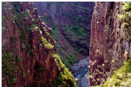
Réserve Naturelle Régionale des Gorges de Daluis