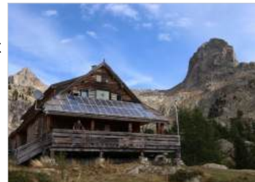
Le Boréon – Saint Martin Vésubie